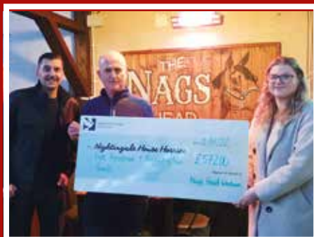
Nags Head Wrecsam – codwyd £572 yn y cwisiau