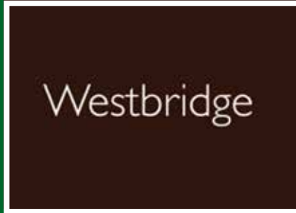
Westbridge Furniture - £206.32