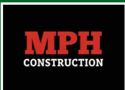
MPH Construction - £750