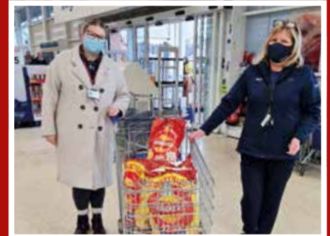
Tesco – diolch am eich cefnogaeth barhaus a'ch rhoddion mewn da