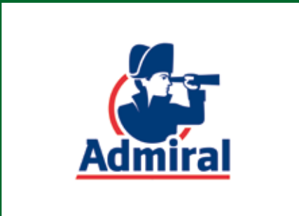
Admiral Insurance - £1,500