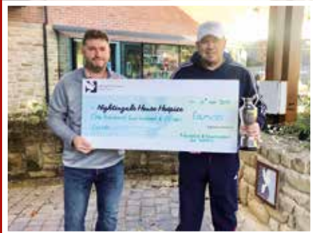
Cododd Diwrnod Golf blynyddol Cadburys/Kronospan £1,415