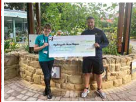
Cododd Teithiau Kings Head Bwlchgwyn £745.27