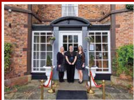
Cododd Gwesty Rossett Hall £138.41 yn eu Cyngerdd Carolau diweddar