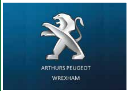
Arthurs Peugeot - £63

Mae llawer o fusnesau lleol wedi cefnogi ein Cynllun Casglu Coed Nadolig ym mis Ionawr eleni drwy wirfoddoli, sgjps a deunyddiau. Gyda'i gilydd, maen nhw wedi helpu i godi dros £15,000.