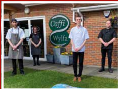
Caffi Wylfa – diolch am eich cefnogaeth ar hyd y flwyddyn