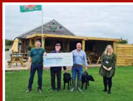
Cododd Pysgodfeydd Commonwood £3,449.30 yn eu gêm bysgota flynyddol rhwng Cymru a Lloegr