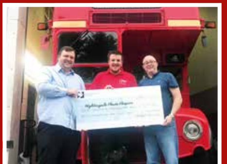
Cododd Bws Fintej Routemaster Blwyddyn Newydd £1,659